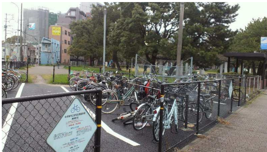
貫線専用軌道入口跡(千代県庁口駅駐輪場)