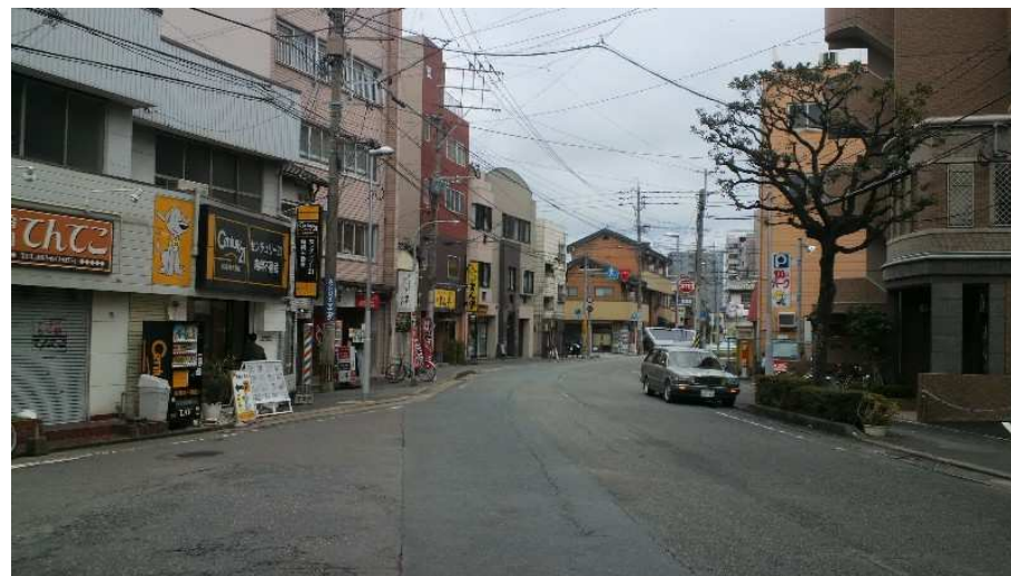
九大前電停跡(九大前バス停は手前の交差点)