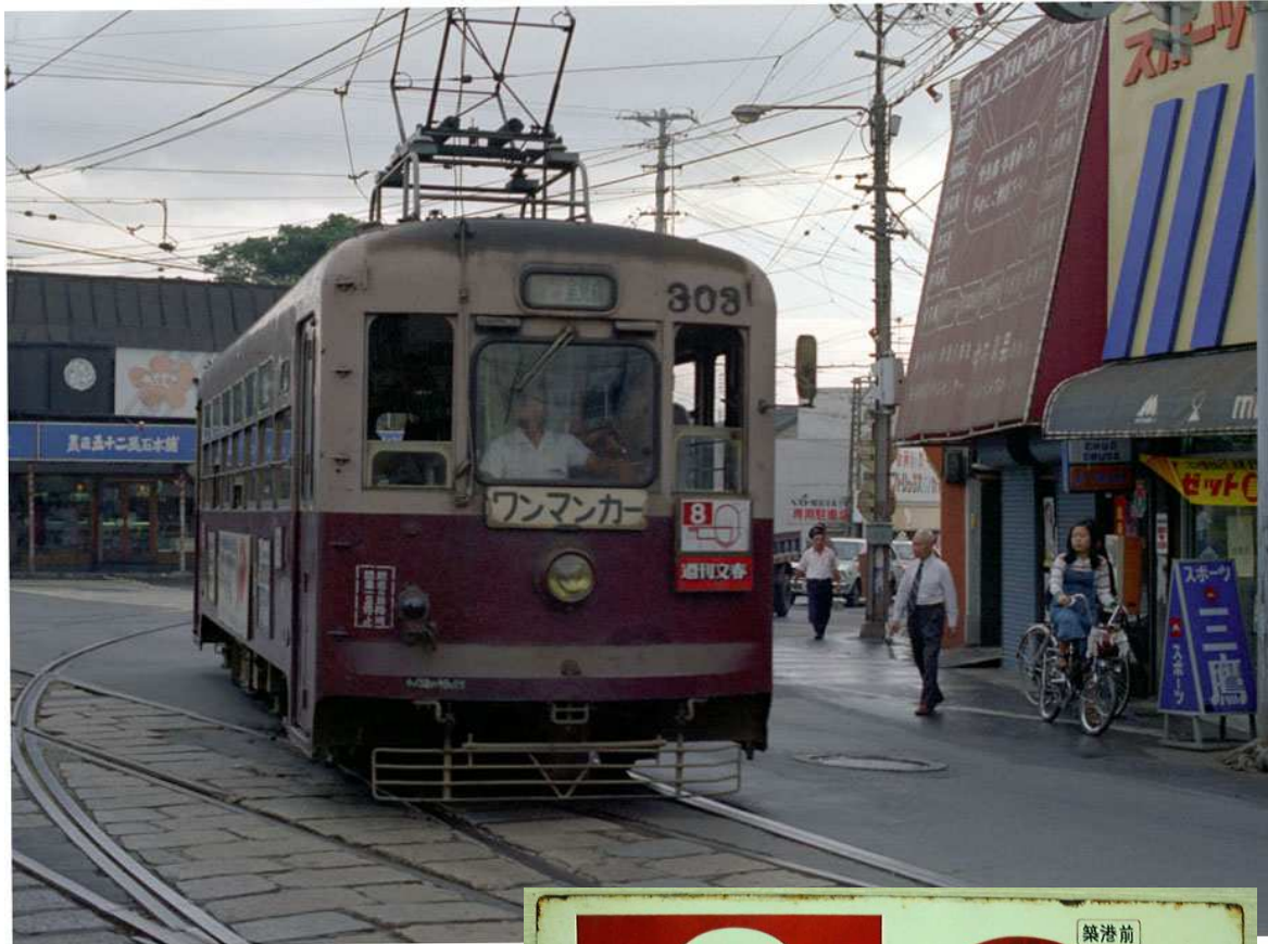
西鉄福岡市内線300形 (8系統・西新分岐点) http://nakamura-2.ees.hokudai.ac.jp/Nishitetsu/1975_2/L_036(303).jpg