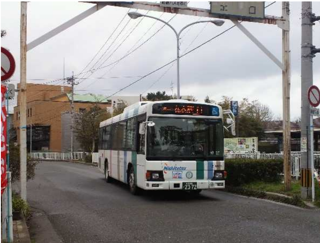
現・九大前行き1系統バス (箱崎宮前駅前箱崎バス停にて) (西鉄バス専用道路出口)

貫線の九大前行きも1系統でした。 バスに替わった今でも、1系統を 守って走っています。今の九大前 バス停は電停跡の手前の箱崎 新道との交差点にあります。