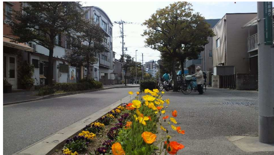
網屋立筋電停跡(網屋松原通り)