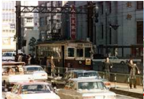
天神電停 (三菱銀行前)