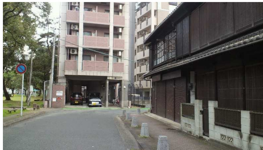
九大病院前電停跡近く(旧家屋と軌道跡のマンション)