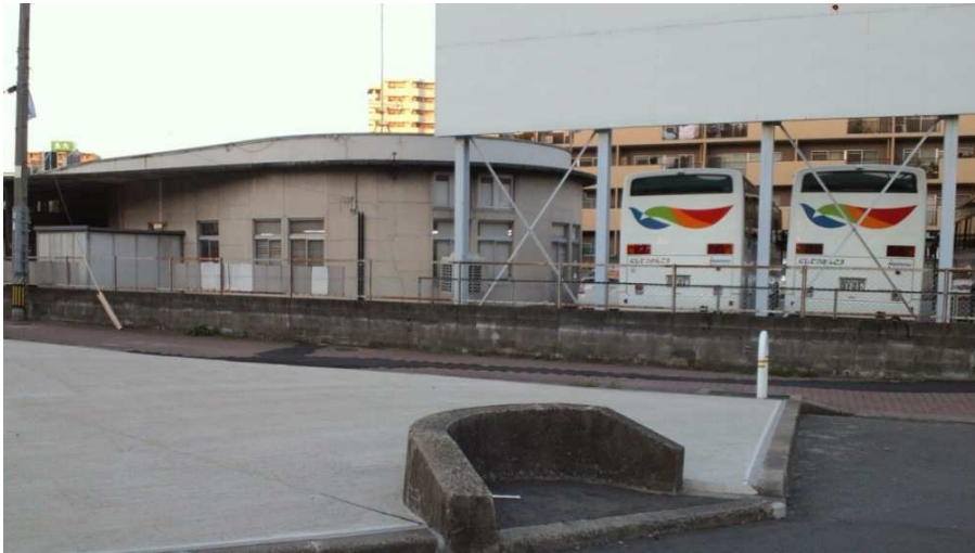
千鳥橋電停跡(西鉄観光千代支社)