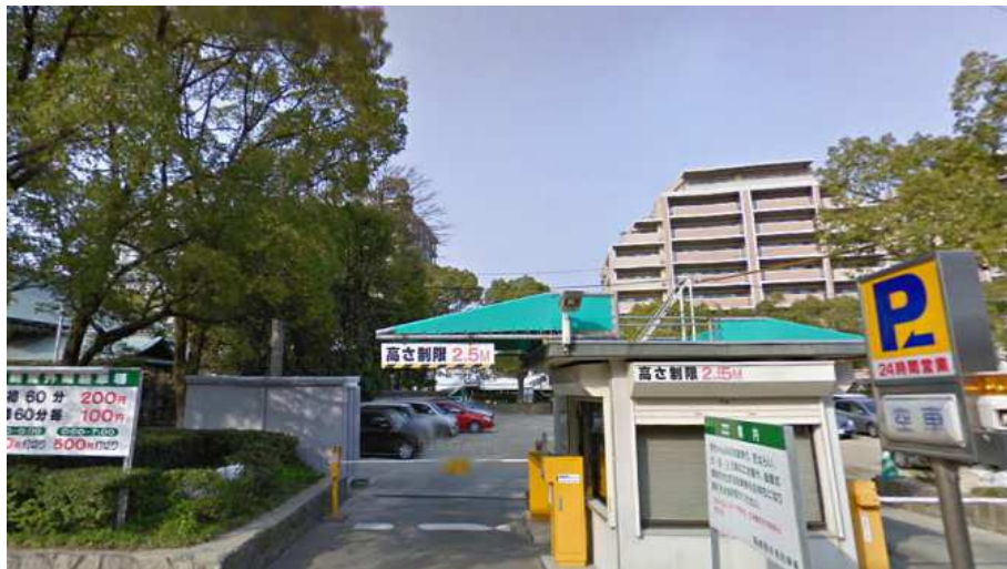
箱崎浜電停跡(箱崎宮駐車場入口)