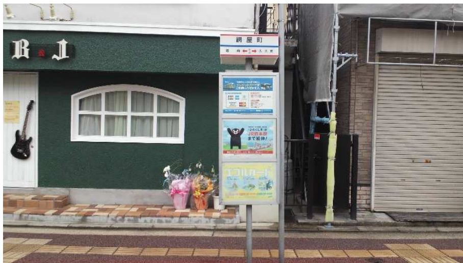
網屋町電停跡(網屋町バス停)