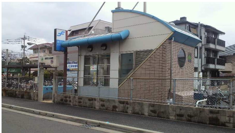
箱崎松原電停跡(箱崎九大前駅エレベータ)