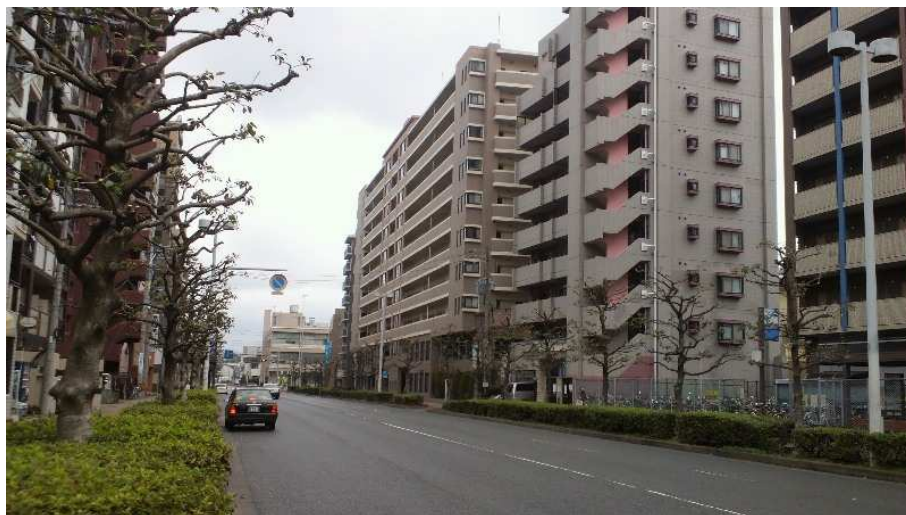
東車庫前電停跡(車庫跡のマンション)