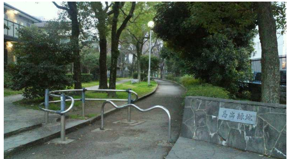
貝塚線専用軌道跡(馬出緑地出口)