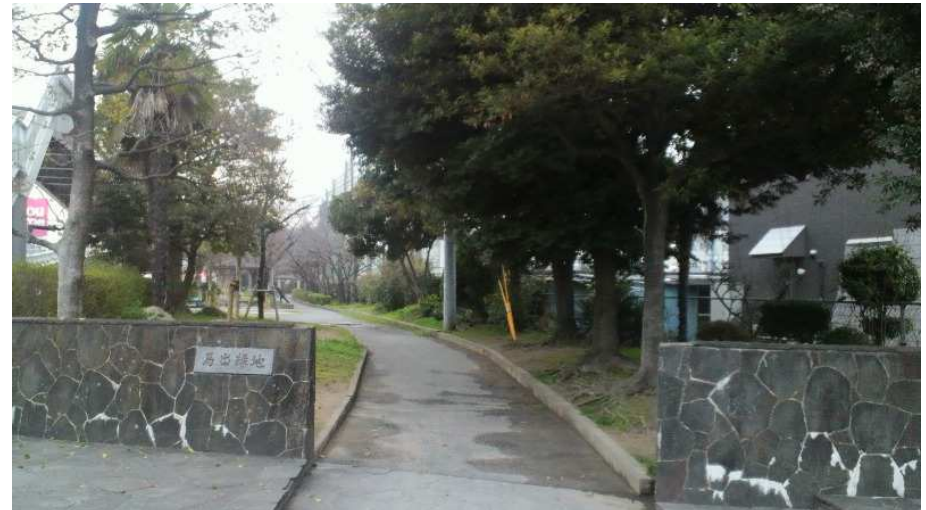
馬出三丁目電停跡(馬出緑地入口)