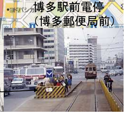
博多駅前電停 (博多郵便局前)