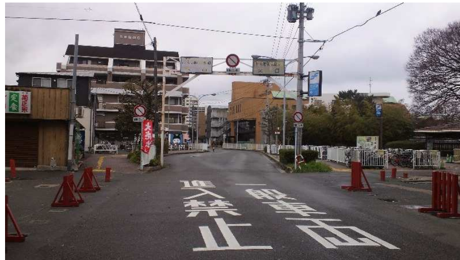
箱崎電停跡(箱崎宮駅、バス専用道路出口)