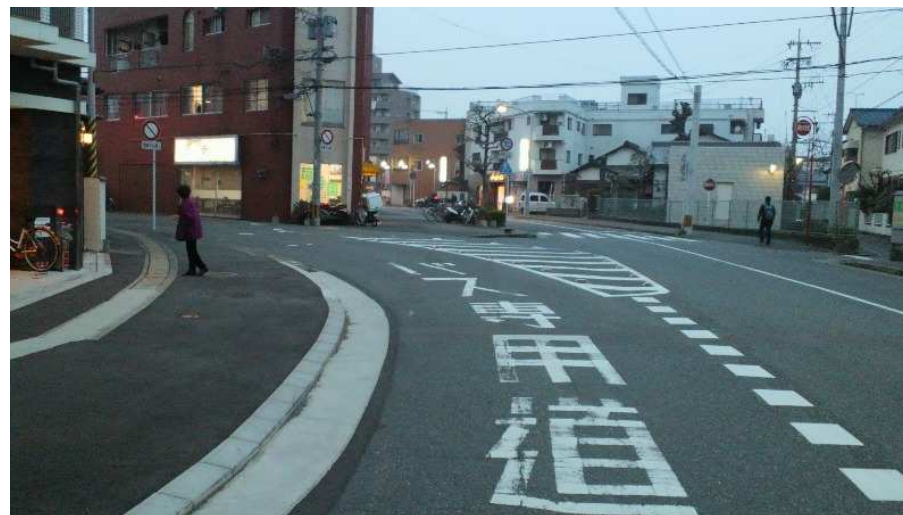
貫線専用軌道跡(バス専用道路入口)