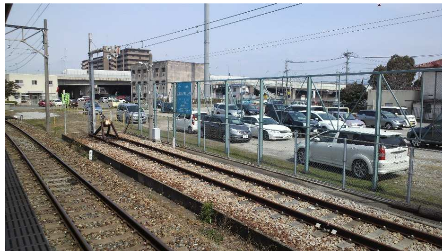
貝塚車庫跡(西鉄貝塚駅駐車場)