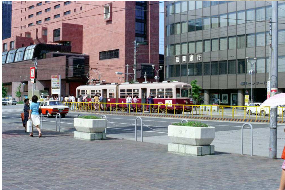
西鉄福岡市内線1200形2両連接車 (博多駅前電停・福岡銀行前) http://nakamura-2.ees.hokudai.ac.jp/Nishitetsu/1975_1/L_005(1205).jpg