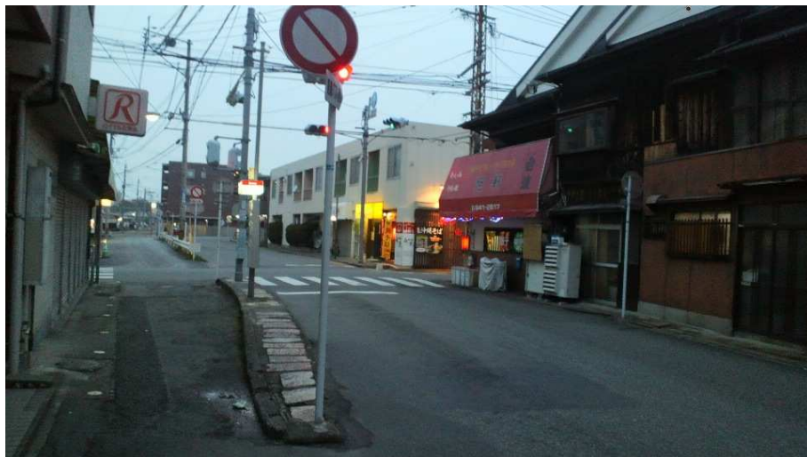
馬出電停跡(馬出通りバス停)