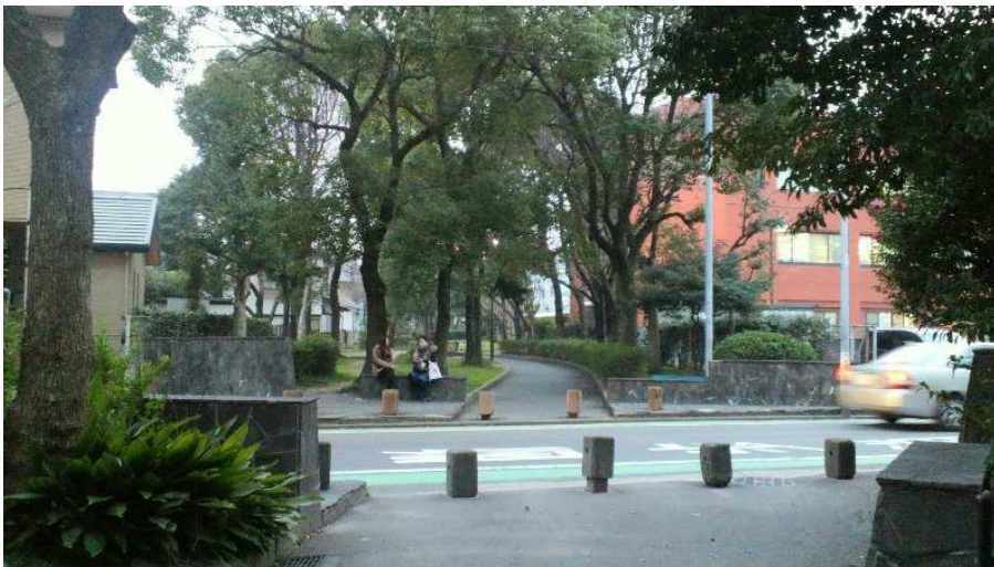
浜松町電停跡(浜松町バス停は右の交差点)